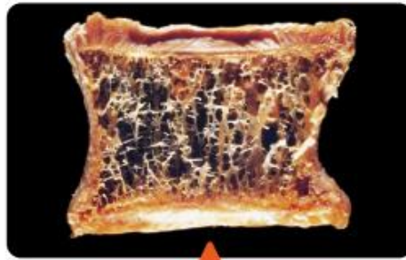
骨粗しょう症の人の骨